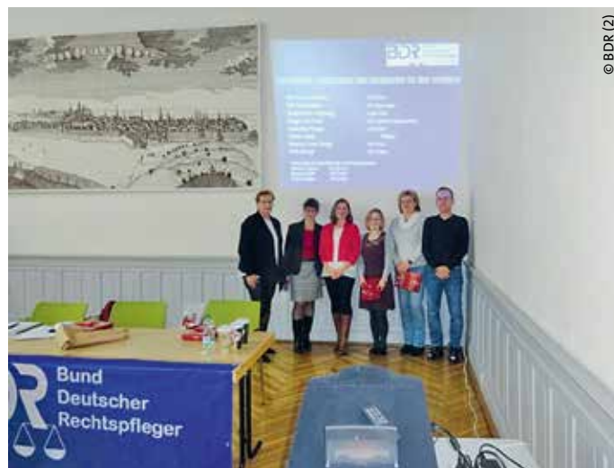
> Der „neue alte“ Vorstand

Noch ist die elektronische Akte in Thüringen eher eine Zukunftsvision, aber 2026