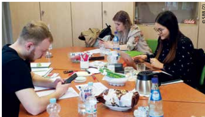
> Kommunikation über soziale Medien wird in der zukünftigen Arbeit der LJL eine große Rolle spielen.

Die individuelle Betreuung unserer Jugendverbände durch feste Ansprechpartner ist nur eine der Ideen, um eine bestmögliche Informationsverteilung zu gewährleisten. Denn immer wieder hören wir von jungen Kolleginnen und Kollegen, dass diese nicht alle wichtigen Informationen erhalten. Ein Beispiel hierfür war das Gewinnspiel zum Tag der Sachsen letzten Jahr. Kaum ein junges Mitglied unserer Fachgewerk-