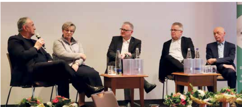
> Zeitzeugen und Mitglieder der ersten Stunden.