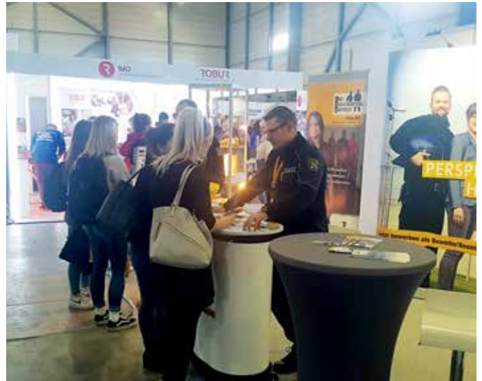
> Engagierte Kolleginnen und Kollegen stellen sich den Fragen auf der Bildungsmesse.

Was muss man für eine duale Ausbildung im Justizvollzug an Voraussetzungen mitbringen und wie funktioniert das Bewerbungsverfahren? Wie gestaltet sich das alltägliche Leben im Justizvollzug? Viele Fragen, denen sich engagierte Kolleginnen und Kollegen auf der Bildungsmesse stellten. Sie gaben einen praxisbezogenen Einblick in den Arbeitsalltag eines interessanten, vielseitigen