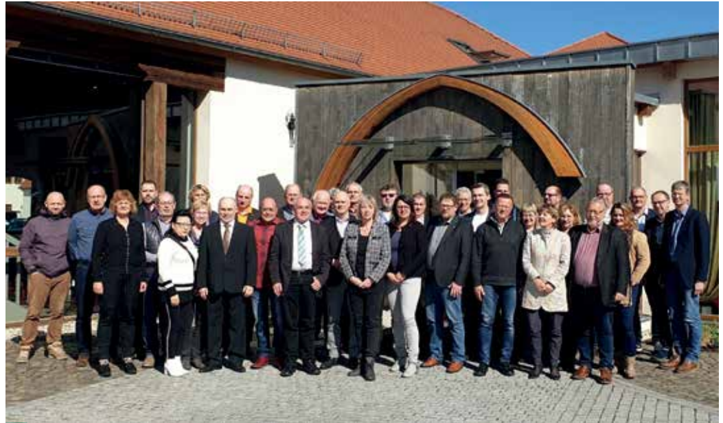
> Das höchste Gremium zwischen den Gewerkschaftstagen: der SBB-Landesvorstand, vertreten durch die Vorsitzenden der 37 Mitgliedsgewerkschaften, hier während einer Sitzung im Kloster Nimbschen

zen. Für uns als SBB Beamtenschaft und Tarifunion gibt es natürlich zunächst zwei wichtige Grundsatzkommissionen (GK), deren Vorsitzende direkt in der Landesleitung gesetzt sind – die GK Beamtenschaft und die GK Tarifrecht. Beide Bereiche spiegeln die beiden Statusgruppen der vom SBB vertretenen Beschäftigten wider: Beamte und Arbeitnehmer. Und während die einen (Tarifrecht) vor allem bei Einkommensrunden gemeinsam mit dem dbb lautstark und engagiert in den Vordergrund treten, sind die anderen (Beamtenschaft) stetig aktiv, wenn es um regelmäßige Anhörungen zu geplanten Gesetzesänderungen im sächsischen Beamtenschaft geht.