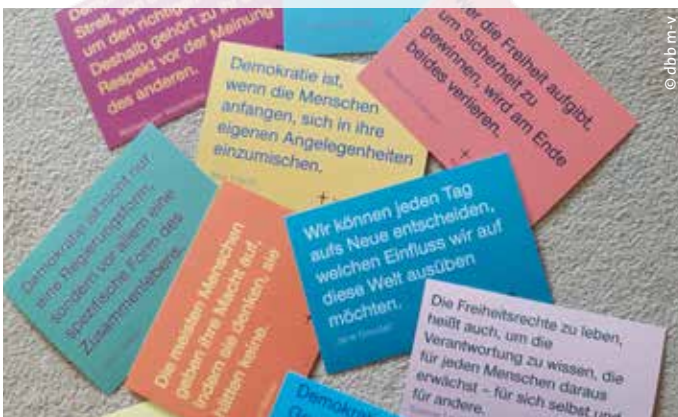
> Thesen zum Thema Demokratie aus Politik, Kunst, Wissenschaft und Philosophie bildeten die Grundlage für eigene Gedanken und Interpretationen der Teilnehmerinnen.

Die Tagungsteilnehmerinnen bewerteten die Veranstaltung abschließend durchweg positiv und nahmen für die weitere Arbeit in den einzelnen Netzwerken auf dem Weg zur Gleichstellung zahlreiche Impulse mit. Die Klausurtagung fand in Kooperation mit der Leitstelle für Frauen und Gleichstellung des Landes Mecklenburg-Vorpommern und dem Frauenbildungsnetz M-V e. V. statt. ■