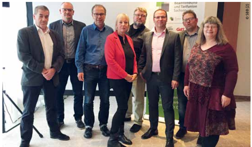
> Die Landesleitung des SBB seit November 2019

Wichtig für die Arbeit des SBB sind aber auch die verschiedenen Grundsatz- und Fachkommissionen, die sich ebenfalls aus Einzelmitgliedern der Gewerkschaften zusammenset-