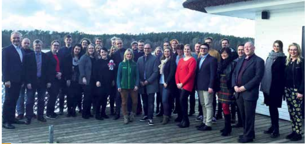
> Die Delegierten des Landesjugendtages mit ihren Gästen, den Mitgliedern der dbb Landesleitung sowie den Vertretern der Wirtschaftspartner

Sowohl zum Landeshauptvorstand am 24. Februar als auch zum Landesjugendtag am 25. Februar ließen es sich das dbb vorsorgewerk und seine Part-