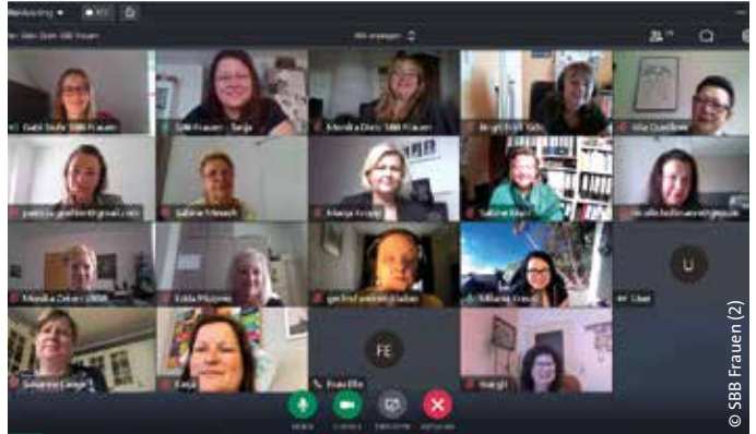
> Die Teilnehmerinnen der Hauptversammlung