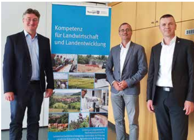
> Aktive Gesprächsrunde im Landesamt für Landwirtschaft und Ländlichen Raum (TLLLR)

hördenstandorte des TLLLR in der Fläche in Thüringen stellte Schönborn heraus. Im Brainstorming kam die Idee eines Behördencampus in Jena am Standort TLLLR auf.