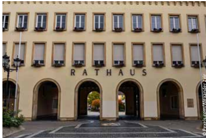
Die Rathäuser spielen eine Schlüsselrolle beim kommunalen Klimaschutz und stehen vor der Herausforderung, eine wahre Flut an Richtlinien und Verfahren zu beherrschen.

Besonders innovativen Lösungen, die Kommunen als Anpassungsstrategie gefunden haben, soll laut Drei-Punkte-Plan der Wettbewerb Blauer Kompass zu Aufmerksamkeit verhelfen. Den veranstaltet das Bundesumweltamt bereits seit 2011. Zum Thema Klimaanpas-