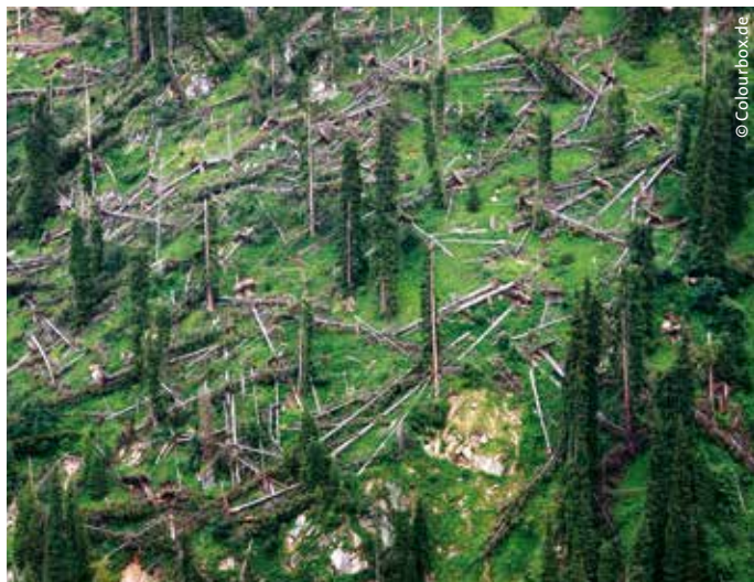
... aber auch Dürre- oder Sturmschäden setzen der Bundesrepublik immer öfter zu.

sung wurde in diesem Jahr das Projekt „KlimawandelAnpassungsCOACH RLP“ ausgezeichnet, das Gemeinden unterschiedlicher Größe und aus verschiedenen Naturräumen in Rheinland-Pfalz bei der Entwicklung von Klimaanpassungsmaßnahmen begleitet und berät. Den Wettbewerb gewann es, weil sich das Vorhaben auch auf andere Kreise, Naturräume und Bundesländer übertragen lässt. Wie dringend notwendig solche Maßnahmen sind, hat die Hochwasserkatastrophe gezeigt, die zuletzt (Stand Juli 2021) Rheinland-Pfalz und Nordrhein-Westfalen in diesem Sommer getroffen und die Bundesrepublik bis ins Mark erschüttert hat.