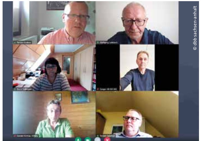
> Mitglieder der dbb tarifkommission sachsen-anhalt diskutieren über Aktionen zur Einkommensrunde TV-L 2021.