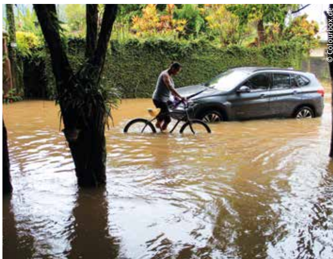
➤ Massive Hochwasserschäden sind eine mögliche Folge des Klimawandels...

„Die Folgen des Klimawandels“, so Schulze in der „Zeit“, „treffen Städte, Landkreise und Gemeinden als Erstes. Das macht die Kommunen zu Schlüsselakteuren bei der Anpassung.“ Doch die Zahl der Beteiligten, Ansprechpartner, Projekte, Empfehlungen, Richtlinien, Fördermittel, Vergabeverfahren, Umsetzungsberater und -hürden ist kaum zu überschauen. Hier setzt der Drei-Punkte-Plan an: Beratung, Be-