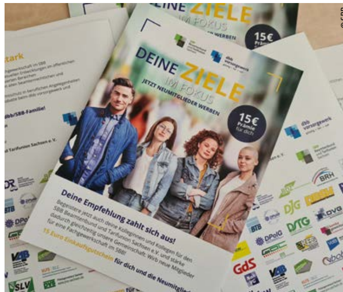
> Flyer Mitgliederwerbaktion unter https://www.sbb.de/fuer-dich/zusammenarbeit/

Das dbb vorsorgewerk kooperiert mit Unternehmen, die eine große Verbundenheit und Expertise für den öffentlichen Dienst mit sich bringen, wie die DBV Deutsche Beamtenversicherung, Wüstenrot Bausparkasse, BBBank eG und Swiss