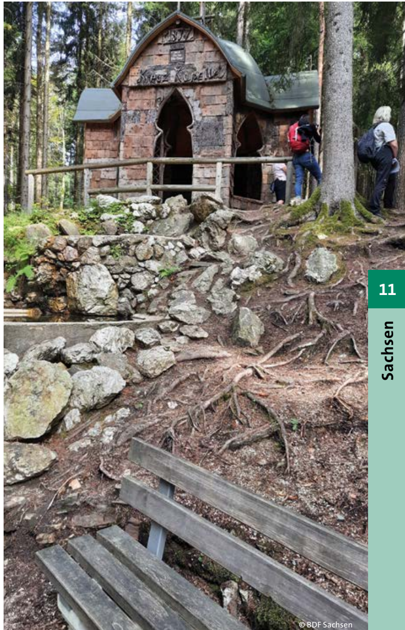
> Blick auf die Kreuzkapelle

Der zertifizierte Kur- und Heilwald am Brunnenberg mit seinen gesundheitlichen Wirkungen bietet dafür die idealen Voraussetzungen. Dies unterstrich zu Projektauftritt auch der sächsische Forstminister Wolfram Günther. Es ist das